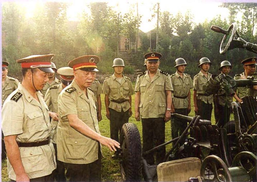
1990年军委副主席刘华清(前排左二)在成都部队视察炮兵训练