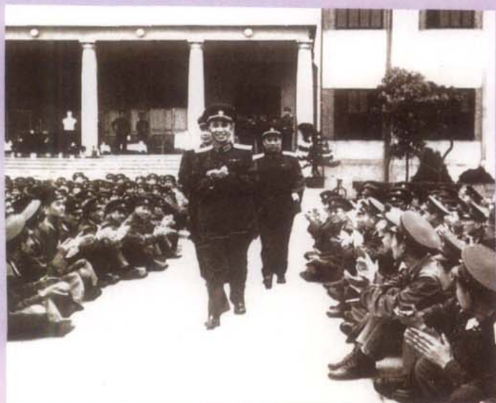
1957年人民解放军总参谋长 粟裕接见驻成都部队官兵