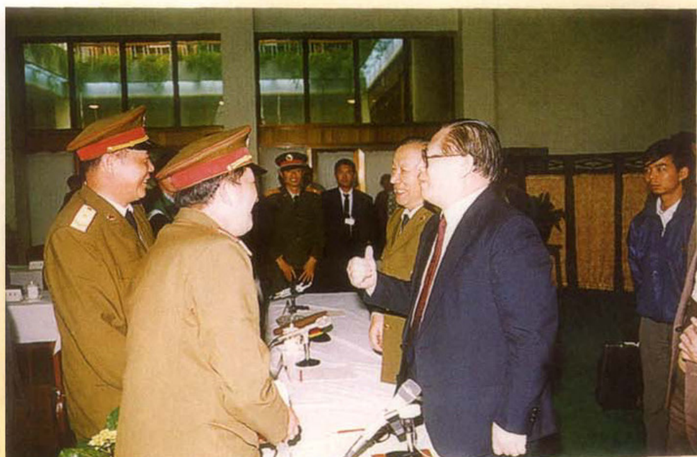
1990年江泽民总书记会见成都军区领导同志