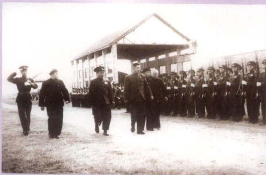
1955年国务院副总理、 国防委员会副主任贺龙元帅 在成都军区司令员贺炳炎、 政委李井泉、四川省长李大 章、中共四川省委第三书记 廖志高陪同下检阅仪仗队