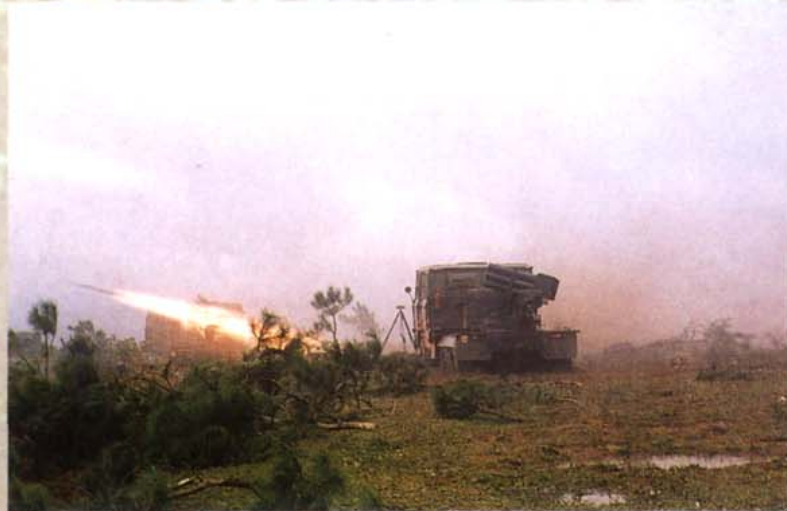
驻川某部火箭炮实弹射击