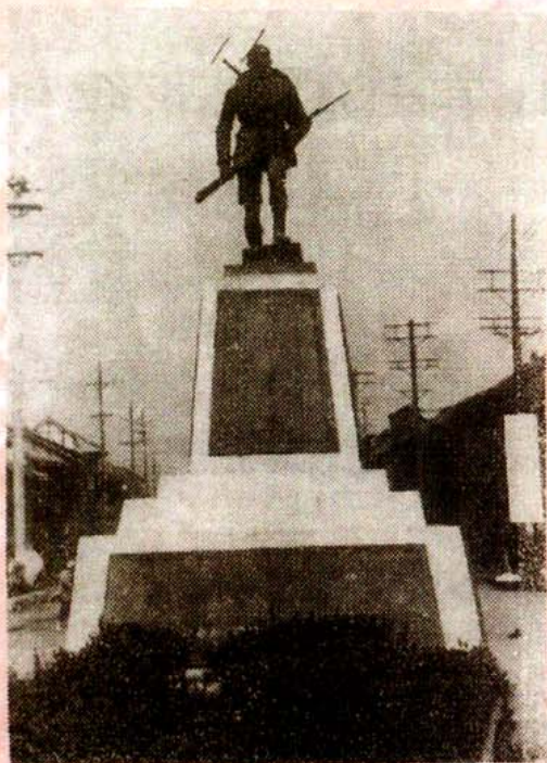
原塑于成都市东门口的 抗战无名英雄纪念像