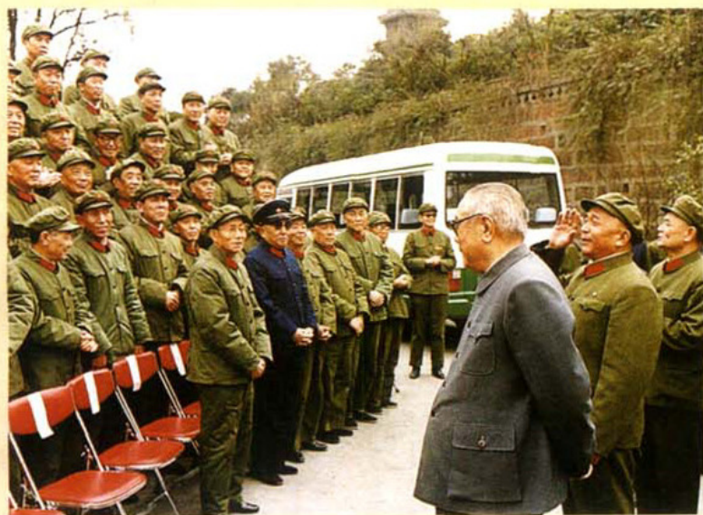
1984年国家主席李先念 在成都军区视察工作