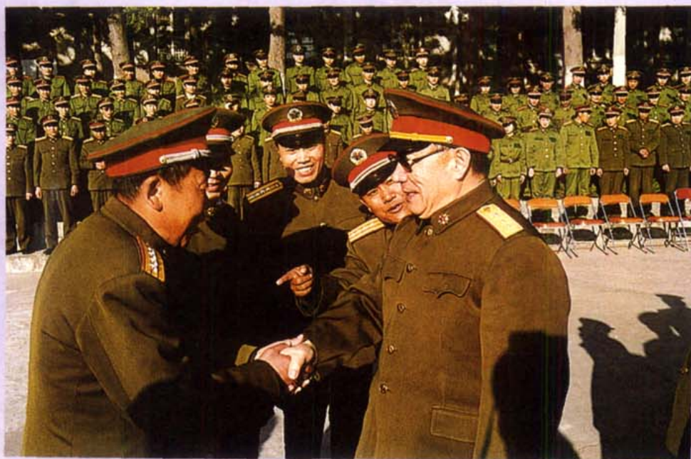
1990年迟浩田总参谋长在西昌分区接见分区全体官兵