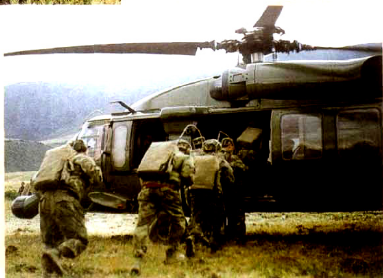
驻川某部演练紧急出动