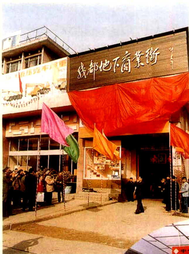
成都市人防平战结合工程 ——地下商业街