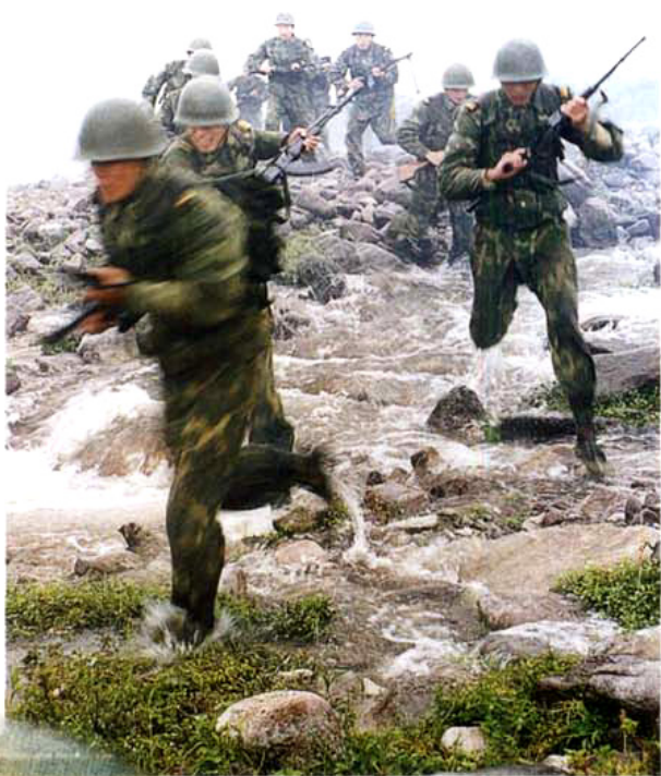
驻川某部山地演练