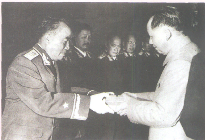
1955年毛泽东主席 给朱德元帅授勋