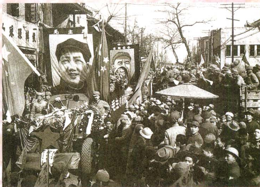
1949年12月30日中国人民解放军举行解放 成都入城式，受到市民群众的夹道欢迎