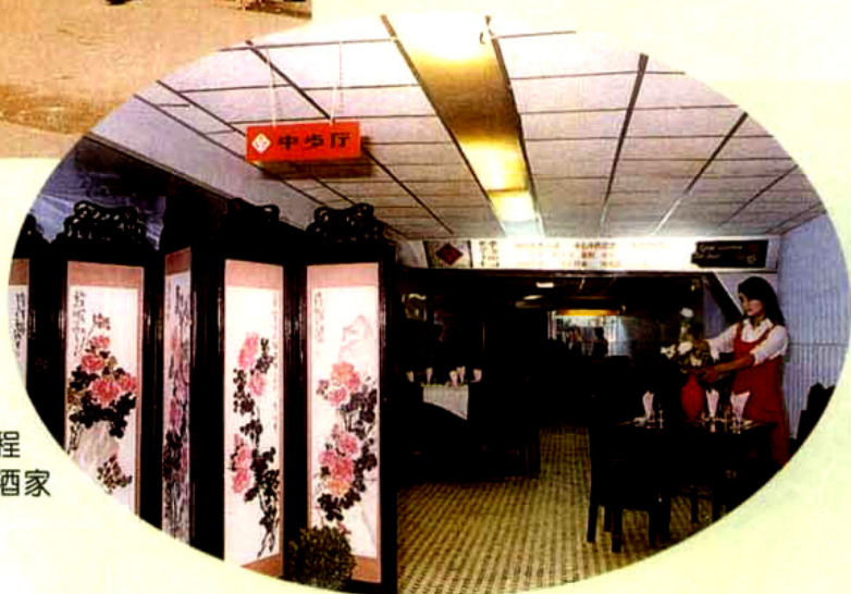
成都市人防工程 ——月季皇后大酒家