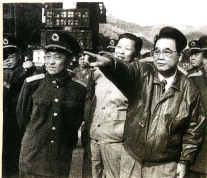
1988年国务院总理李鹏 视察西昌卫星发射中心