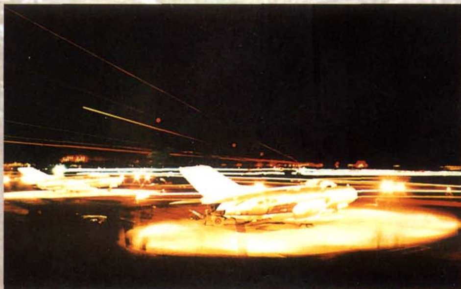
驻川空军夜航训练