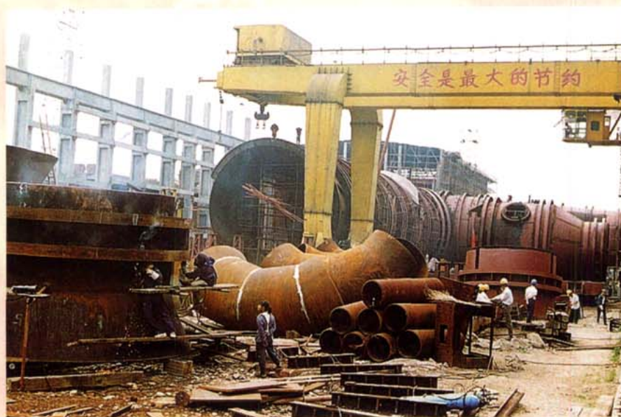
亚洲最大的跨声速风洞场在四川建设中