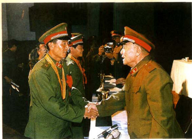
1986年中央军委副主席 杨尚昆在成都接见军区基层 建设表彰会代表