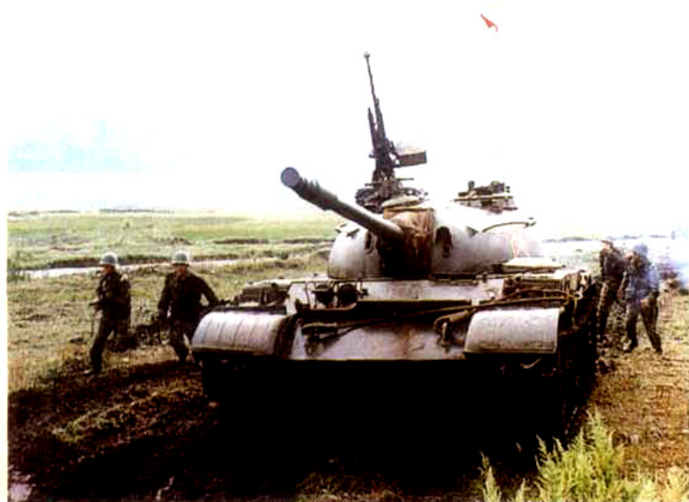
驻川某部组织综合演练