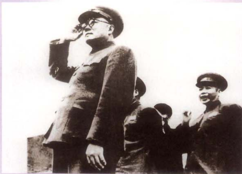
1950年西南军政委员会 主席刘伯承出席西南军政委 员会第一次会议