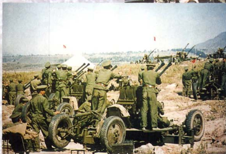
高射炮兵实弹射击