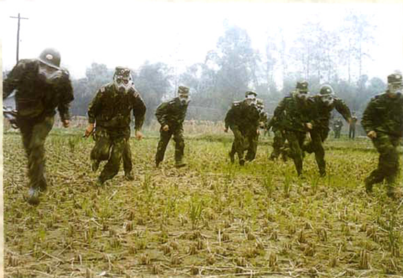
驻川某部防化学野营训练