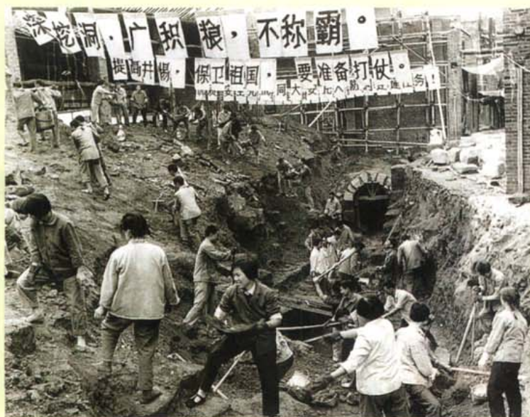
自贡市轻工机械厂职工 义务劳动构筑人防工程