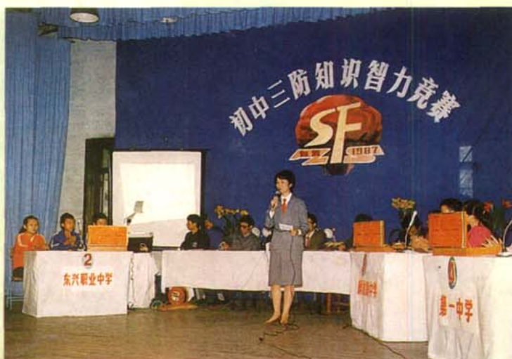
自贡市中学生 三防知识智力竞赛