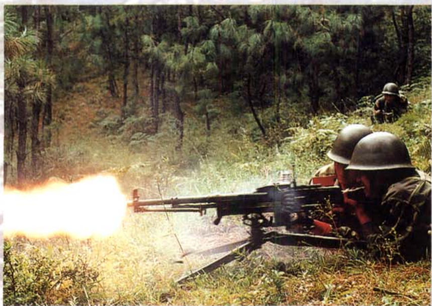
驻川某部侦察分队 进行快速反击训练