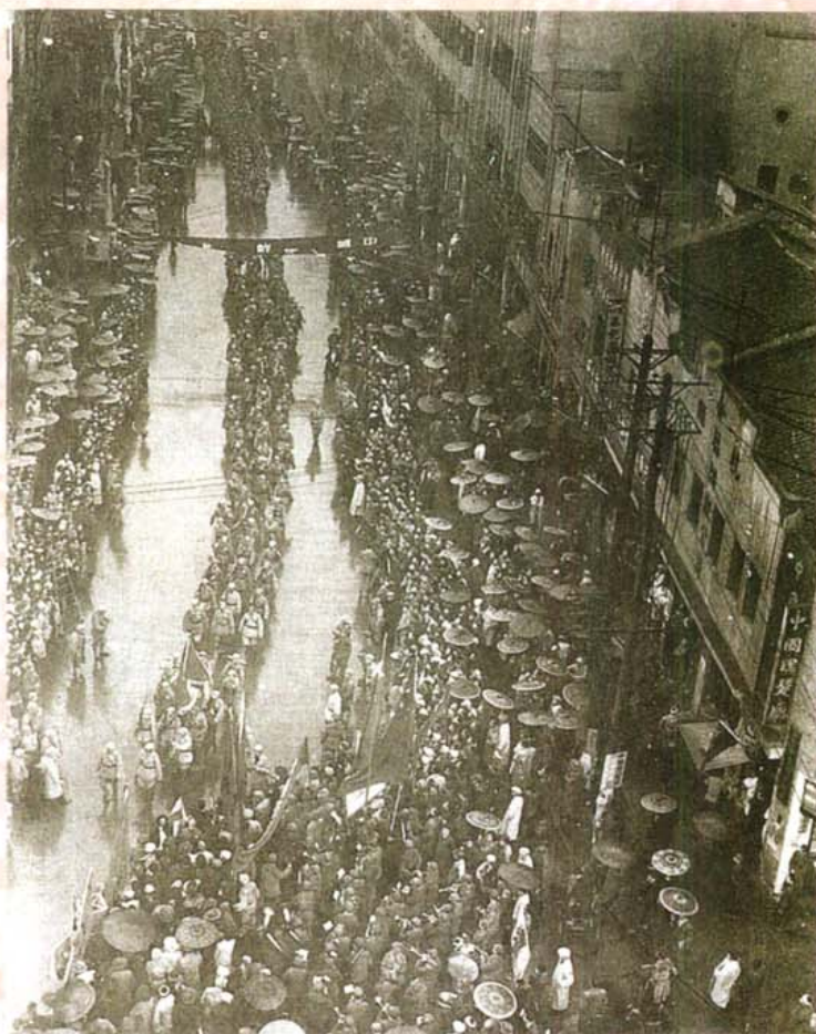
1949年12月1日中国人民 解放军冒雨进入重庆市中区