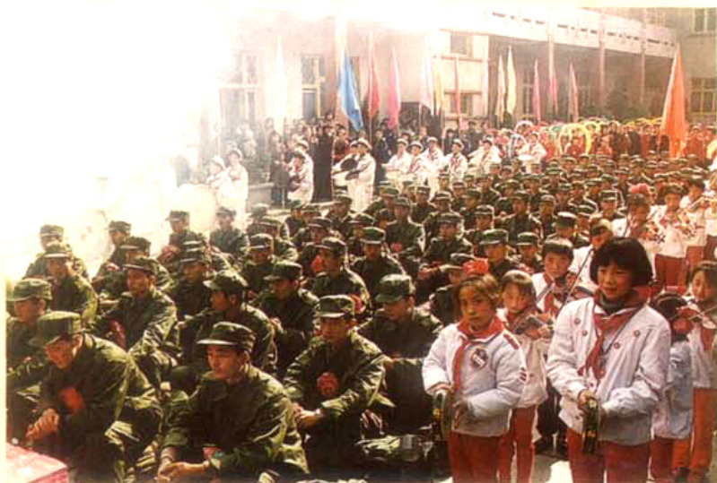
眉山县热烈欢送 应征青年入伍