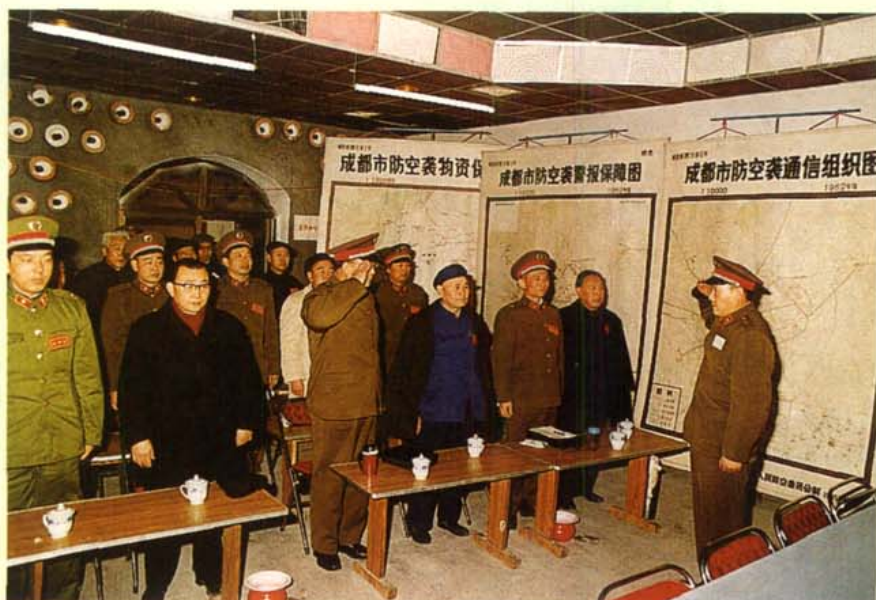
1986年成都市在 金河人防工事组织城 市防空袭演习