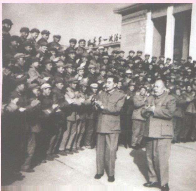
1964年周恩来总理、 陈毅副总理在成都接见驻 川部队四好连队、五好战 士代表会议全体代表