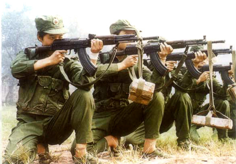
某通信团女兵 进行射击训练