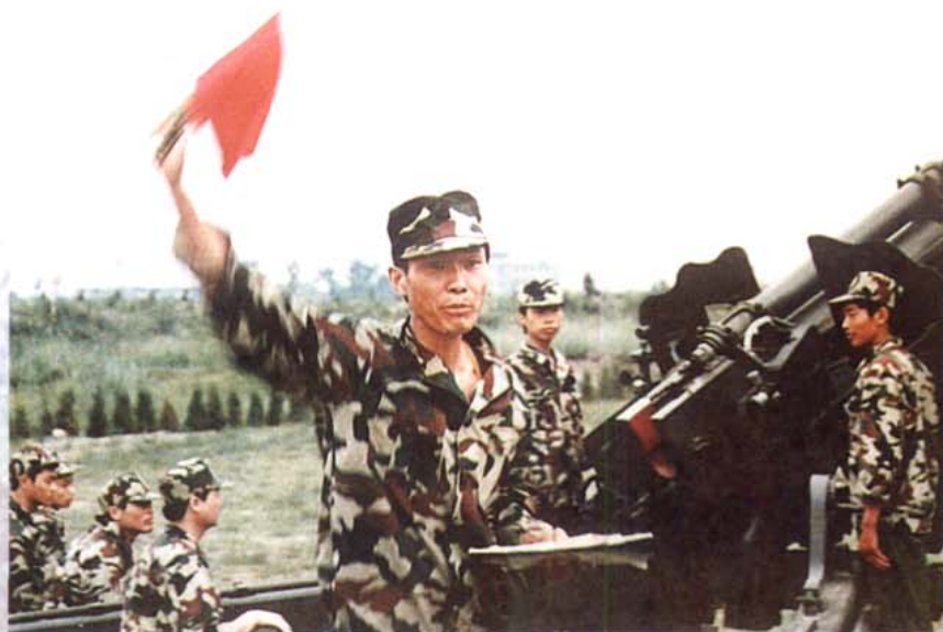
广汉民兵正在进行 大口径火炮训练