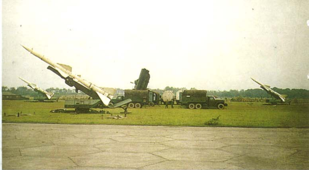
驻川某地空导弹部队实弹射击训练