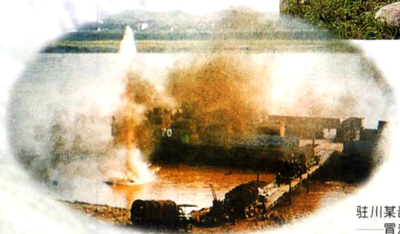
驻川某部组织战役集训 ——冒着轰炸紧急登船