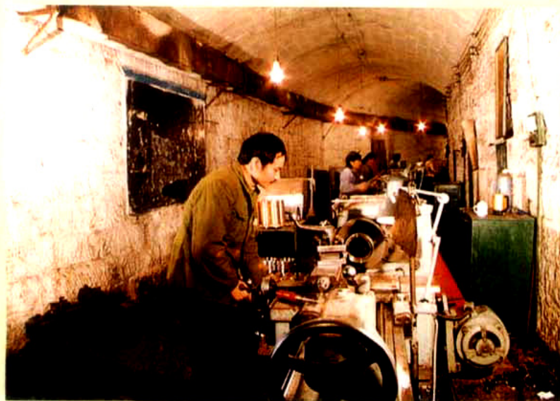
重庆矿山机器厂地下车间