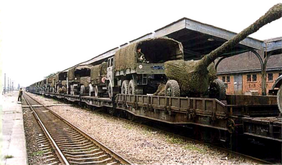
驻川炮兵部队实施铁路运输