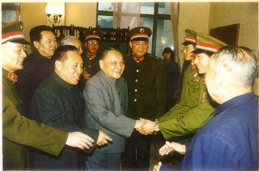
邓小平接见成都部队英雄模范代表