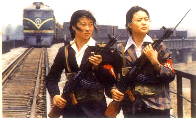
乐山夹江护路 女子民兵连的民兵