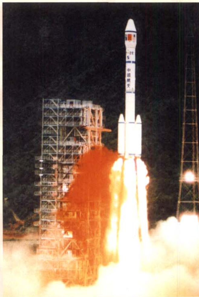
「长二捆」火箭携「澳88」卫星 在西昌发射中心点火升空的情景