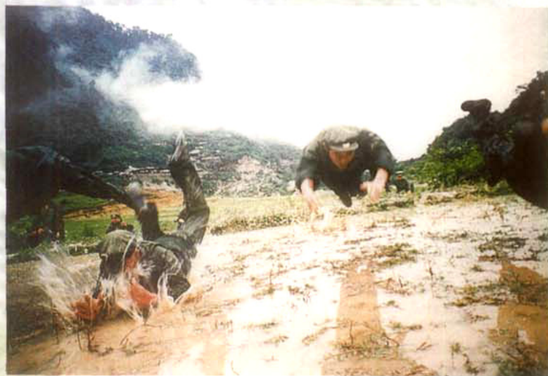
驻川某部侦察兵训练