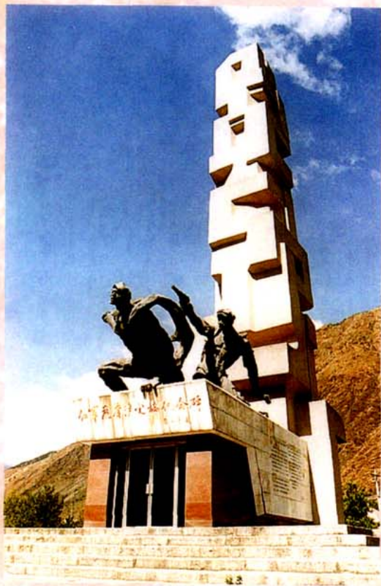
红军飞夺泸定桥纪念碑