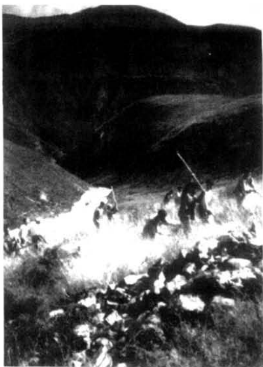
驻巴塘的7810部队3连在海拔3000多米的高原上开荒种地

驻川部队农副业生产起步较早。解放初期,部队一面剿匪,一面开荒种地,1950~1953年开荒1100多亩。50年代中期,部队利用平叛作战间隙,在少数民族地区种小麦、栽蔬菜、养家畜,解决了边沿地区部队的部分肉、菜供应,也为少数民族发展农副业生产起了示范推动作用。海拔3400米的东俄小站,养猪成活率100%,破除了康藏高原不能养猪的迷信。凉山驻军开荒种地,有的连队一年收蔬菜23万多公斤,改变了彝族不种菜的习惯。1955~1957年,部队转入正规化训练,生产规模缩小。