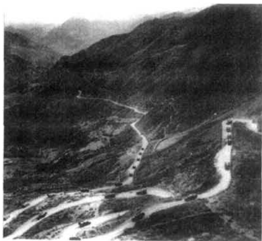
汽车某团二连车队行进在二郎山三道拐

新中国成立后,驻川部队积极参加国家有关部门的计划、组织、实施国防交通网络建设,交通保障力量动员,交通保障手段的改善等工作,协助交通部门搞好军事运输。60年代初,成立由成都军区和四川省主要领导参加的交通战备领导小组,本着平战结合